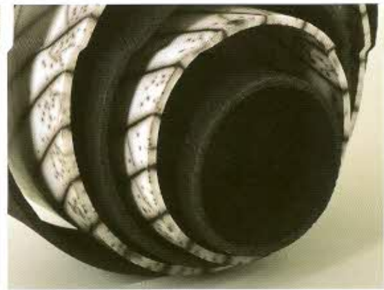
תנועה, 2011, תערוכת של אבנית עם פורצלן, בנייה סמשסחים, סירוק, חיפוי בטרה סיגילטה ושרפת ראקו, ס"מ 40/80/25